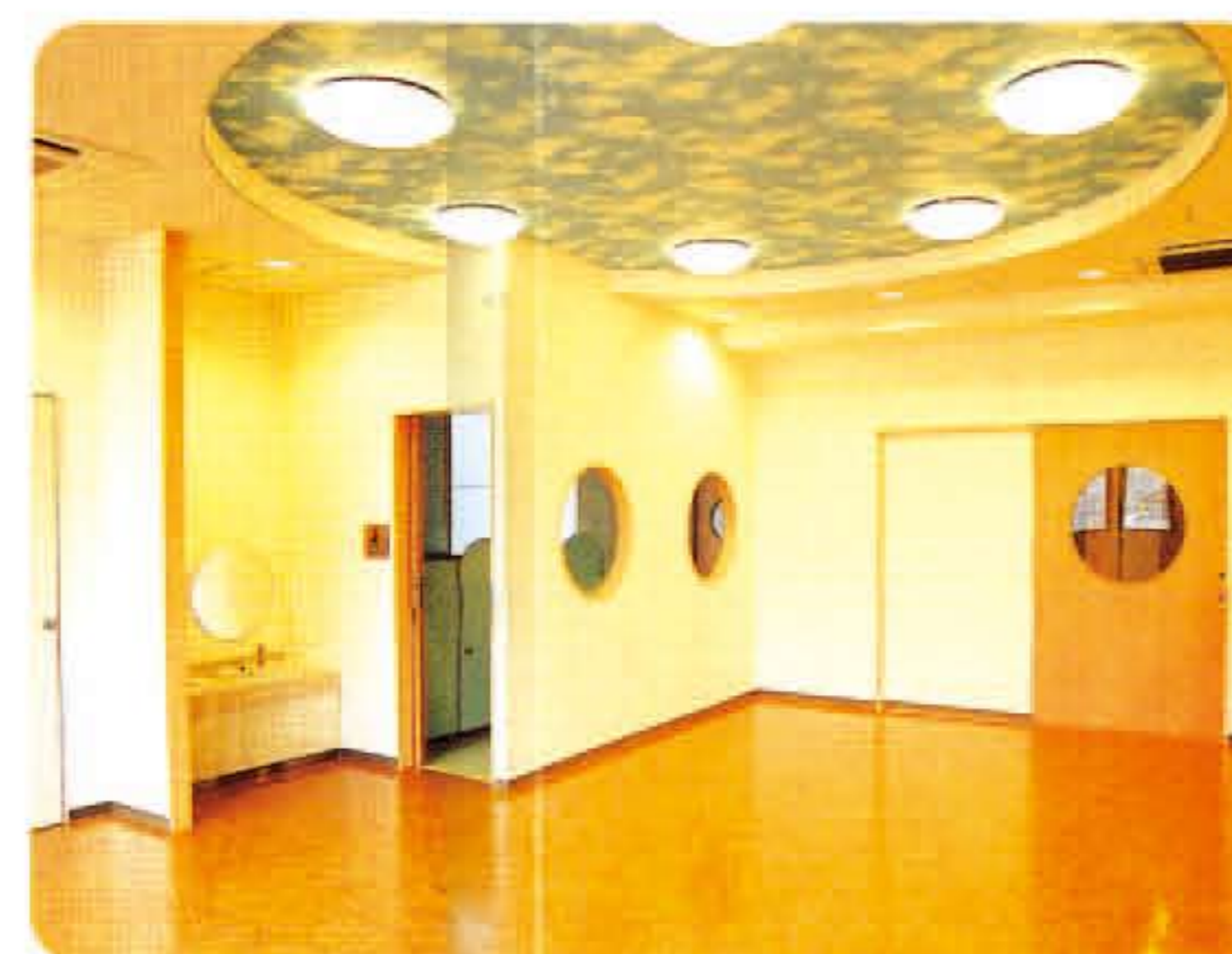
子育て交流サロン