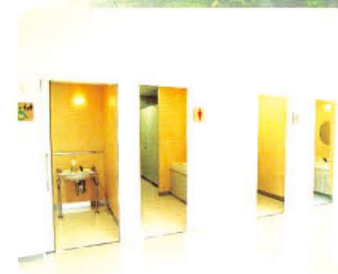
ユニバーサルデザインを取り入れたトイレ