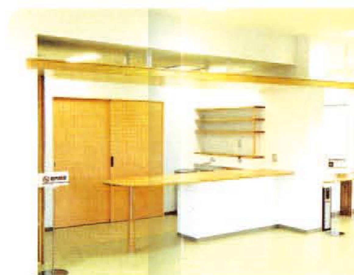
軽食も可能な喫茶室