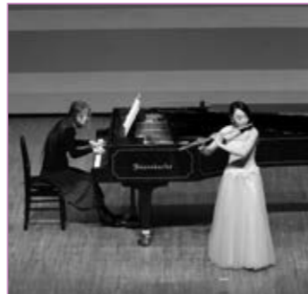
1月8日(日)島田市出身コンクール受賞者によるコンサートにて(プラザおおるりホール)