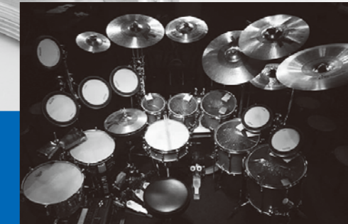
神保彰のドラムセット

12月1日(土)に下記の新規受付を行います。 ・平成25年12月分プラザおおるりホール・島田市民会館ホール ・平成25年6月分プラザおおるり会議室等・島田市民会館ホール集会室等(月1回ご利用の方) ・平成25年1月分プラザおおるり会議室等・島田市民会館ホール集会室等(月2回以上ご利用の方) 会場:プラザおおるり1階 第1多目的室 時間:8時30分までにお集まり下さい。 お問い合わせ プラザおおるり受付 ☎36-7222