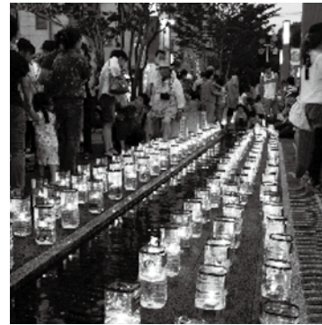
島田元氣市夕涼み市