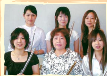
〈第1部〉リバティーフルートアンサンブル