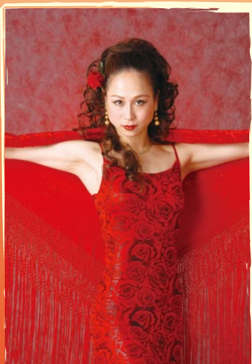
〈スペシャルゲスト〉LOLA(ローラ)