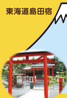
東海道島田宿御陣屋稲荷神社 （別名：悪口稲荷）